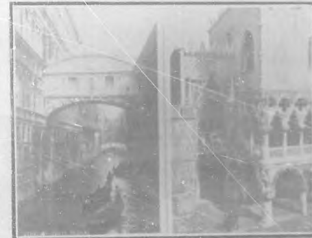
El Puente de los suspiros.

El Canal, en una vuelta amplia, nos muestra el célebre Ponte di Rialto, que es reliquia de la Venecia gloriosa.