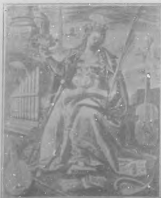
Santa Cecilia, por Martin de Vos, célebre pintor flamenco.

¡Cecilia! fué el grito del Emperador. Enmudeció el pueblo, ebrio en el mayor desenfreno de su bacanal. Con más vivo fulgor en su rostro transmutado fué Cecilia arrancando notas á las cuerdas, mientras dos jóvenes de la nobleza arrojaban flores á los cuerpos empabados. Un anciano bendecía hincado de rodillas á las almas següentes que volaban como palomas encarnísticas entre las crepitaciones siniestras de la carne chirriante.