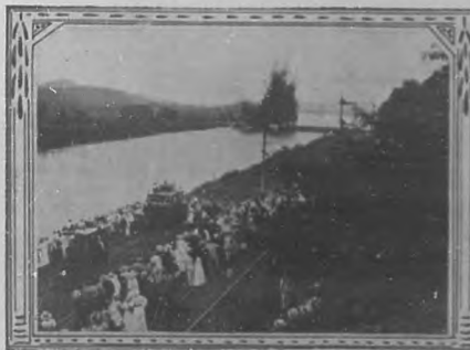
El dique de Gamboa (Panamá) en el momento de explotar.

En el pasado número y en la inspirada poesía de nues-