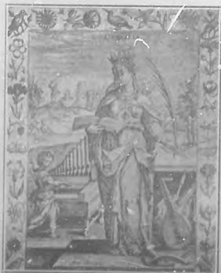
Santa Cecilia, por Adrien Collaert, célebre pintor flamenco.

táculos que más divertía al pueblo era la fiesta de las antorchas, iniciada por Nerón. Consistía en quemar á los cristianos imbragados de pez y sujetos á postes en un paseo público, y entre el chisporroteo de la carne crugiente y el estruendo de la alegría, se escuchaban divinas estrofas, himnos y plegarias. Se iba el alma alegre en aquellas llamas de la carne y el flameo de las visiones cécicas, de la eternidad. Vestida de blanco, cubierto todo el pecho de flores de limonero, una joven cuya belleza era ponderada en la corte con los más gráficos