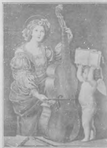
Santa Cecilia por Le Dominicus.