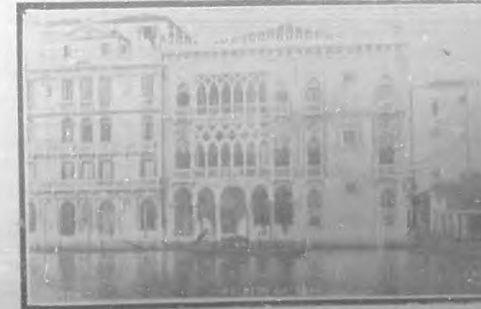
El Ca' d'Oro.