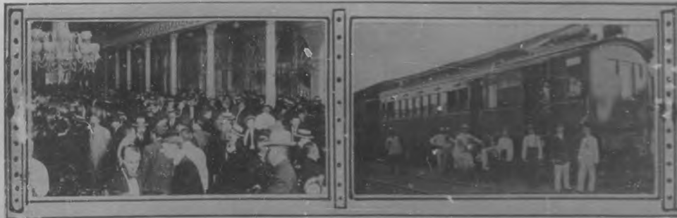
Reunión de dependientes de cafés, restaurantes y fondas para pedir el trabajo de diez horas.—Los progresos de Santo Domingo.—Vista del primer carro eléctrico que ha circulado por esta rica con rica San Francisco. El aludido carro es propiedad de la "Ban Central", poderosa empresa ferrocarrilera de Sagua la Grande, que tanto se afana por el progreso de sus negocios.

La nueva Directiva se encuentra animada de los mejores deseos y proyectos, y se propone hacer cuanto pueda por el desarrollo del deporte cinegético.