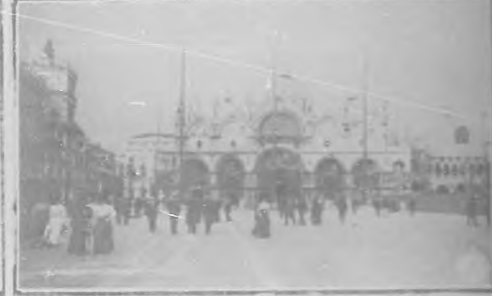
Iglesia de San Marco.