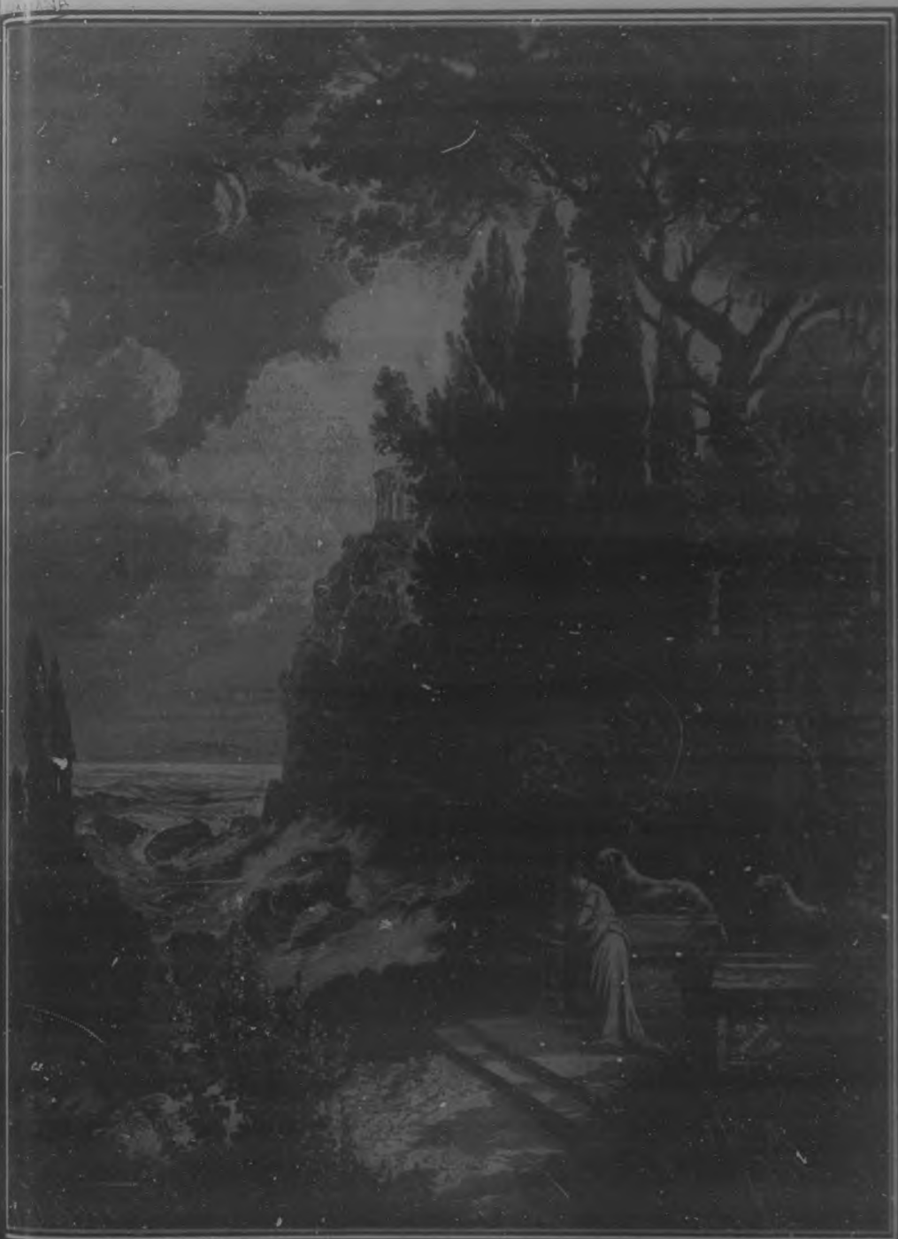
Villa romana á orillas del mar.—Cuadro de Makau.