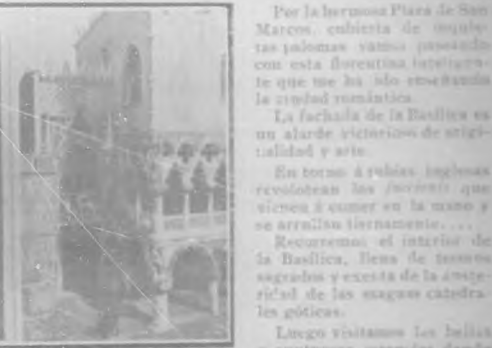
Encajería de piedra.