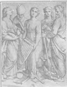
Santa Cecilia, por Raphael Sanzio Vaticano.

elogios, entre los cuerpos flameantes acompañaba con el címbalo las canciones de la fe.