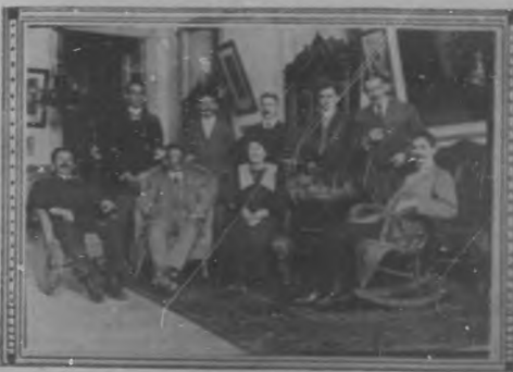
"Club de Cazadores del Cerro". Nueva directiva para el presente año.