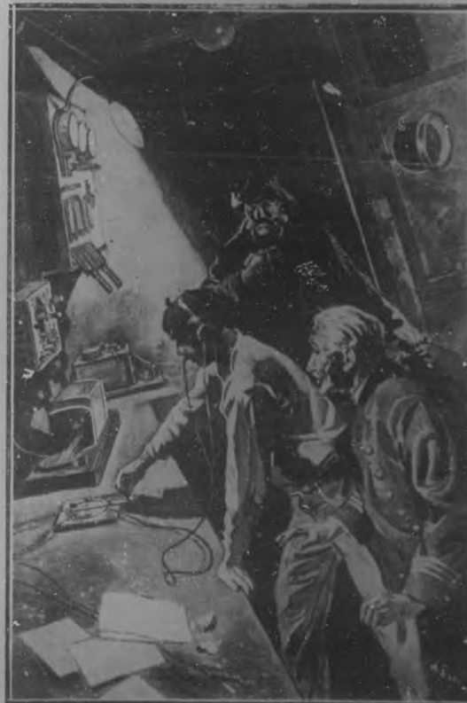
Interesante momento de aviso de peligro por el aparato Marconi.

«Los Reyes de esta democracia palpitante, mezcla de demagogia y de oclocacia, no tienen por qué abominar de la forma de gobierno no monárquico. Estos modelos modernos que sintetizan la suprema aspiración de las libertades populares—que eso deindividua les es har to discutible —no asumen la dirección de los Estados desprovistos de preparación adecuada.