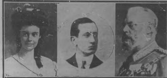
NOTAS EUROPEAS.—De izquierda á derecha: La Princesa Cecilia, esposa del heredero del trono de Alemania; fundadora de la casa de enseñanza para niños ciegos y paralíticos. Guillermo Marconi, inventor de la radiotelegrafía. El Regente de Baviera que ha sido elevado al trono con el nombre de Luis III.

«¿Qué más bien? ¿Qué mejor felicidad? Carne- gie que ha aspirado á la apoteosis mundial, daría su fortuna triplicada por ser Marconi un día, pero es que el genio de ha cer dinero no reporta sino una satisfacción, cuando se llegó á crear un capital; pero cuando se llega á cimentar la telegrafía, se ha acumulado el capital supremo de la resurrección. ¿A cuantos ha resucitado Marconi? ¡Cuántas vidas no ha arrebatado su invento á la muerte!