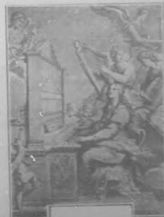
Santa Cecilia, por C. Segur, grabado.

El anciano Pontífice las llevó á las Catacumbas, para que los que