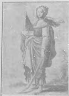
Santa Cecilia, por David Teniers, el viejo, célebre pintor flamenco.

Desde el trionfismo, en el magnífico templo de Jano, gritaba el Prefecto: "Apláquese la ira de los dioses con la sangre inmundada de los cristianos." Y empezaba la degollación. En el gongüteo de la sangre que manaba de las arterias rotas calan los salmizos de los abotargados por las orgías impuras y la rabia supersticiosa. Era en los tiempos de Alejandro Severo y de su viejecito llamado Urbano, emperador uno, que había acumulado en Roma todas las