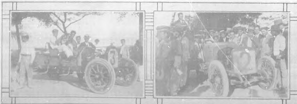
Carreras de Automóviles.—Máquinas números 2 y 3 vencedoras en las carreras de velocidad efectuadas en la calzada de Ayestarán.

A su ilustrado autor enviamos desde estas páginas nuestros más sinceros plácemes.