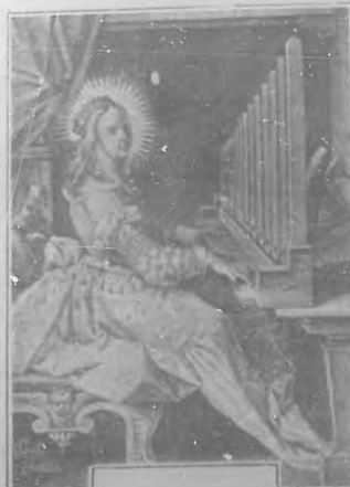
Santa Cecilia, por Le Guérin.

Por olerlas murieron degollados. Por olerlas digo, porque el perfume de las flores místicas les encendían en sus almas los aiores infinitos y les daban la heroicidad del valor. Manaban flores de aquellas guirnaldas, eran tantas como un surtidor, con un vendabal de perfume; como gotas de un manantial, de un río de amor cuyas olas plañideras, alegres á horrisonas son las palpitaciones del corazón un-