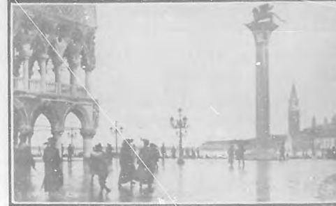
El León de Venecia.