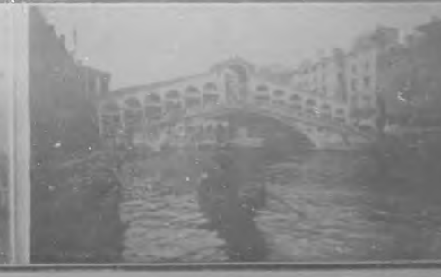
Ponte de Rialto.